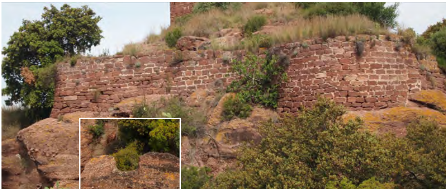
▲ Vista exterior de la muralla i l'accés original, al punt 5.

Segle XXI: Continua la recerca arqueològica amb resultats cada vegada més rellevants. El 2010 s'enceta el camí cap a la recuperació i consolidació de Sant Genís. Elaboració d'un pla director, excavacions arqueològiques i obres de consolidació