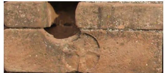
▲ Una de les tombes presents a Sant Genís, decorada amb la creu que es va interpretar al segle XVIII com a pertanyent als Templers. En realitat es tracta d'un monestir benedictí, sense relació amb aquell orde militar.