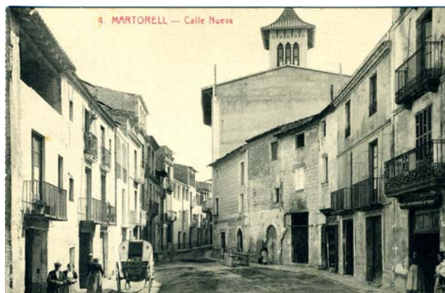
▲ L. Roisin. Carrer Nou, actual carrer de Pere Puig.

de les diferents col·leccions (1914-1915, 1917-1918, 1918-1919) d'una botiga de betes i fils i de joguines de M. Aznar , situada a la plaça, que inclou vistes parcials de Martorell, el pont del Diable, el pont de ferro de la carretera de Terrassa, la font de la Mina, etc. Als anys 20 la Fototipia Thomas va editar algunes postals acolorides amb taques difuminades de diversos tons.