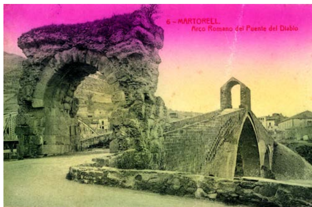
▲ Fototipia Thomas. Pont del Diable. Postal colorida.