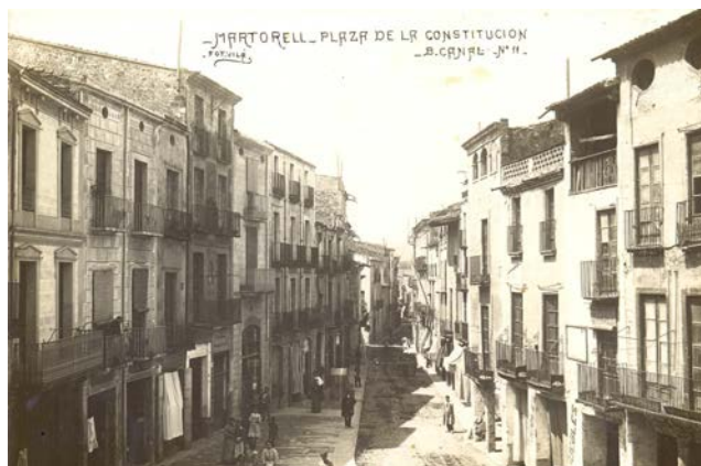
▲ Vilà - B. Canals. Plaça de la Vila.